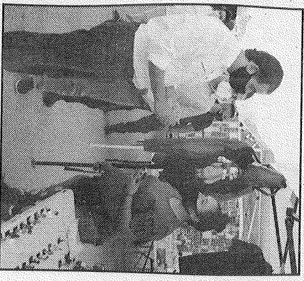
El alcalde habló con los oferentes